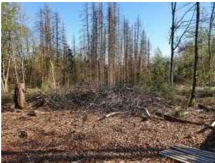
Abb. 7 Schlagflur