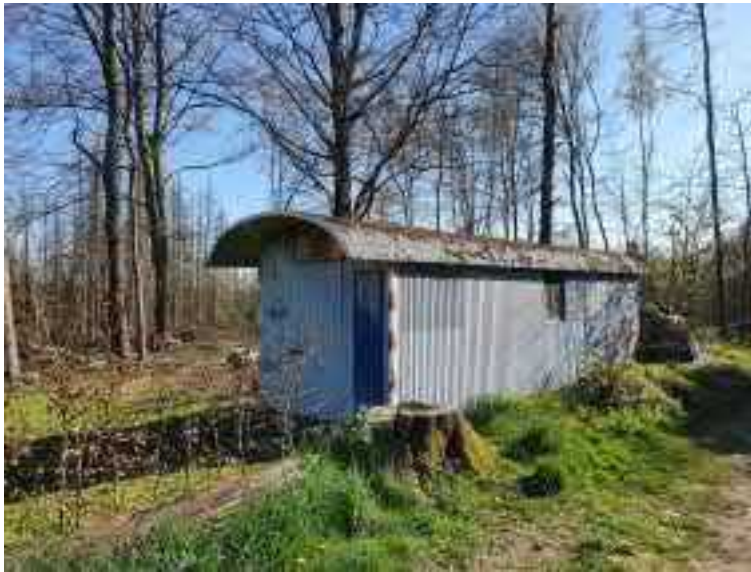
Abb. 9 Schuppen ohne Einflugmöglichkeiten