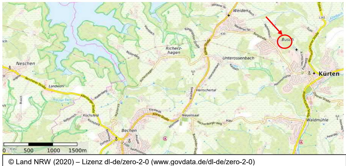
Abb. 2 Übersichtskarte mit Kennzeichnung der Lage des Grundstücks

Für die Abfrage der planungsrelevanten Arten gemäß LANUV ist zunächst die Feststellung der Lage des Plangebietes (MTB 4909 Kürten, 2. Quadrant), die naturräumliche Zugehörigkeit (kontinentaler Bereich) sowie die Feststellung der im Plangebiet vorhandenen sowie der angrenzenden und ggf. ebenfalls betroffenen Lebensraumtypen notwendig.