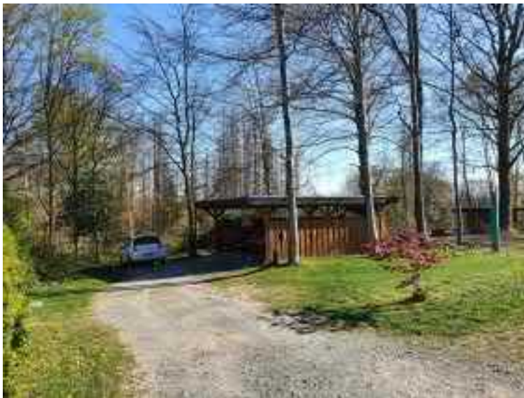
Abb. 5 Baufeld 1

Die näher untersuchten Flächen im Änderungsbereich des Bebauungsplans 30 werden überwiegend als Hausgarten, als Stellflächen für Kfz genutzt oder liegen brach infolge von großflächigen Fällarbeiten.