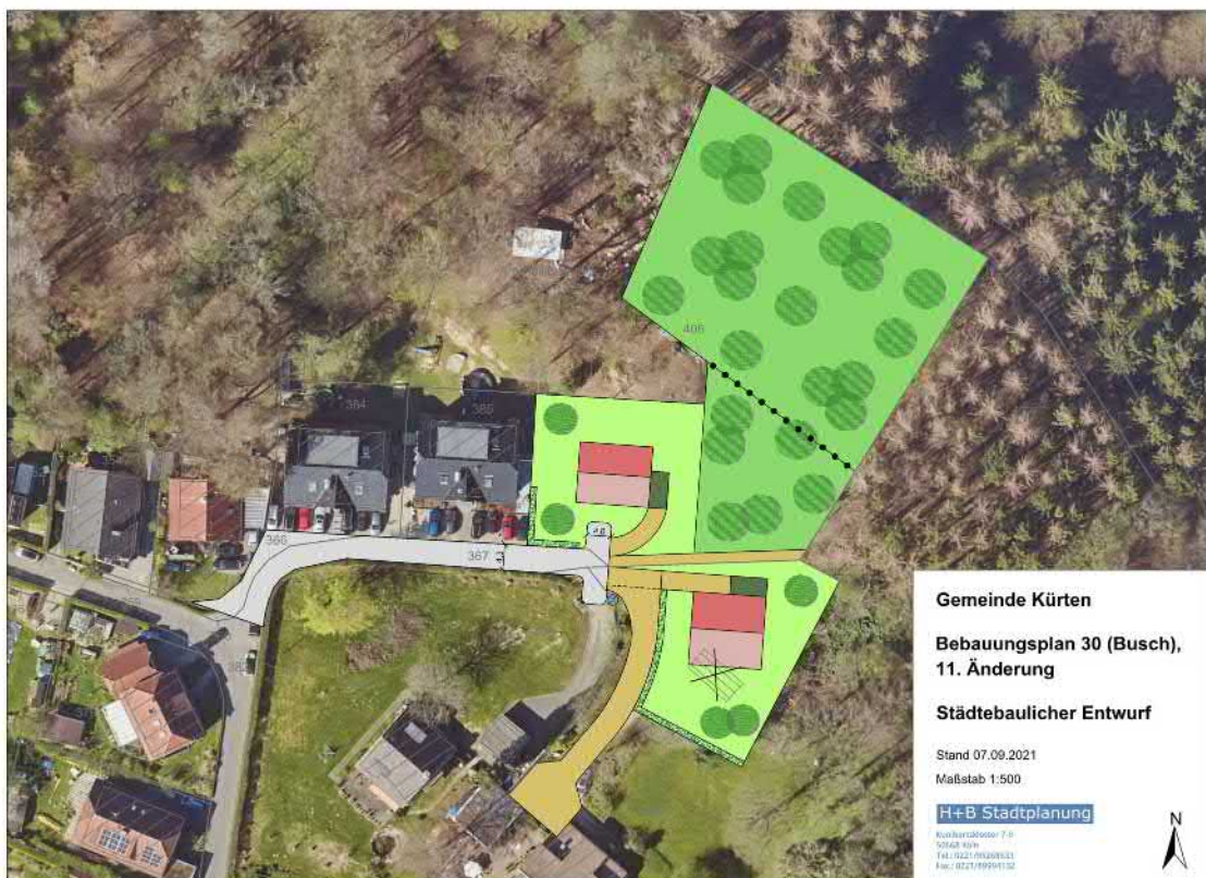
Abb. 1 Städtebaulicher Entwurf (mit Luftbild)

Das derzeitige Planungsrecht lässt eine Wohnbebauung jedoch nicht zu. Daher stellen die Eigentümer der Flurstücke 396 und 406 einen Antrag auf Erweiterung und Änderung des Bebauungsplans 30. Auf beiden Grundstücken ist die Errichtung von jeweils einem freistehenden Einfamilienhaus für den jeweiligen Eigentümer bzw. dessen Familienangehörige vorgesehen.