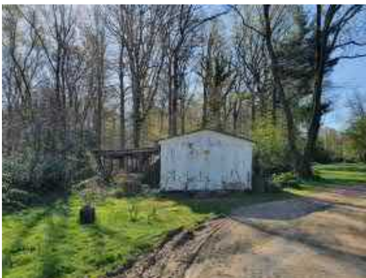
Abb. 8 In Teilen baufälliger Schuppen