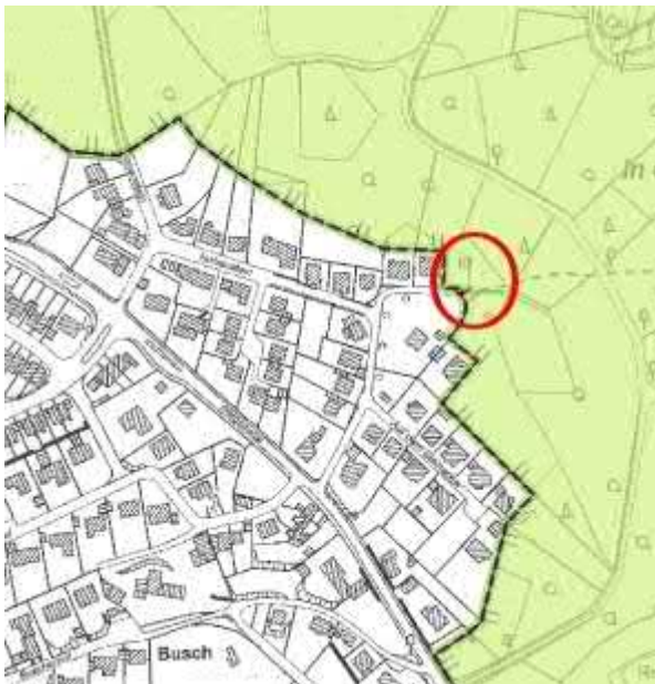
Abb. 4 Ausschnitt aus dem Landschaftsplan mit Kennzeichnung der Lage des Plangebietes

Das Plangebiet liegt nicht im Geltungsbereich des Landschaftsplans des Rheinisch Bergischen Kreises. Östlich der B 206 grenzt am Rand des Ortsteils „Neuensaal“ das Landschaftsschutzgebiet L 2.2-4 „Bergische Hochfläche um Kürten, südlich Biesfeld“ an. Die Schutzgebietsausweisung erfolgt zur Erhaltung und Entwicklung der Kulturlandschaft für die Land- und Forstwirtschaft, als ökologischer Ausgleichsraum und ländlicher Erlebnisraum sowie zur Erhaltung wichtiger Biotopverbund- und Vernetzungsräume.