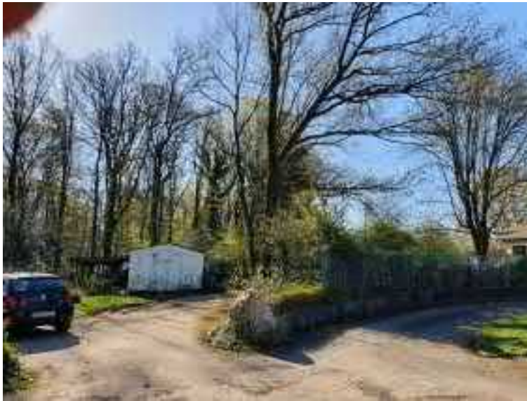
Abb. 6 Baufeld 2