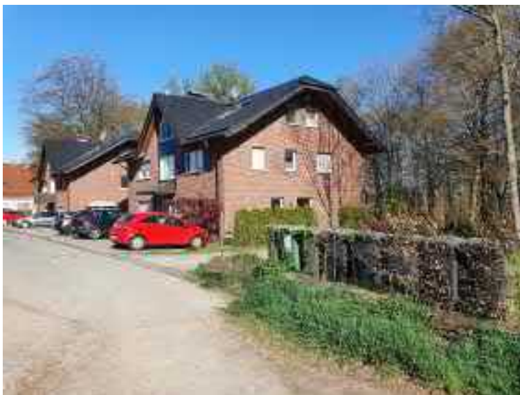
Abb. 10 Bestehende Bebauung, rechts davon Baufeld 1

Die abgebildeten Baufelder werden wie bereits erwähnt zur Zeit als Abstellmöglichkeiten für Kfz und als Hausgarten genutzt. Auf beiden Baufeldern befinden sich Schuppen, die im Falle einer Bebauung beseitigt werden müssen. Die Schlagflur soll mit standortgerechten Gehölzen aufgeforstet werden. Der vorhandene ältere Baumbestand (Rotbuche, Bergahorn und Eiche) auf den geplanten Baugrundstücken soll durch entsprechende Festsetzung im Bebauungsplan gesichert werden. Gartenvegetation, Säume und Kleingehölze gehen hingegen verloren.