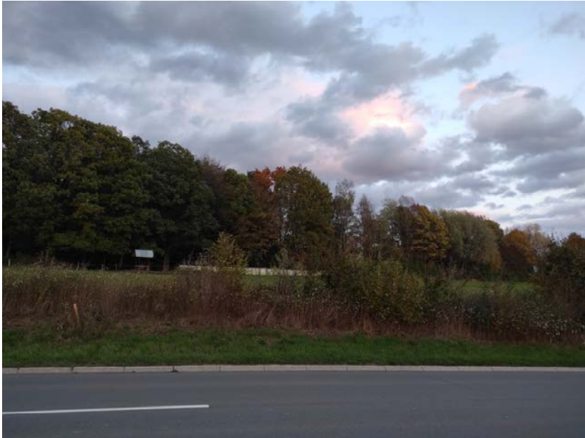
Abb. 2 Waldrand an der nordöstlichen Plangebietsgrenze

Das relativ kleine Tier bewegte sich dabei vorzugsweise und auf wiederholten Flugrouten im Luftraum (ca. 3 bis 5 m Höhe) in direkter Nähe des Wald- bzw. Gehölzrandes. Die windstilleren Bereiche östlich der Baumhecke in Richtung des Hofes „Antoniushöhe“ wurden dabei auch aufgesucht. Teilweise war das beobachtete Exemplar aber auch außerhalb der Kronentraufbereiche unterwegs. In dem für Zwergfledermäuse typischen „hektischen“ Flug jagte das Tier in der Nähe des Waldrandes bis ca. 1 m über der Grünlandfläche nach Insekten.