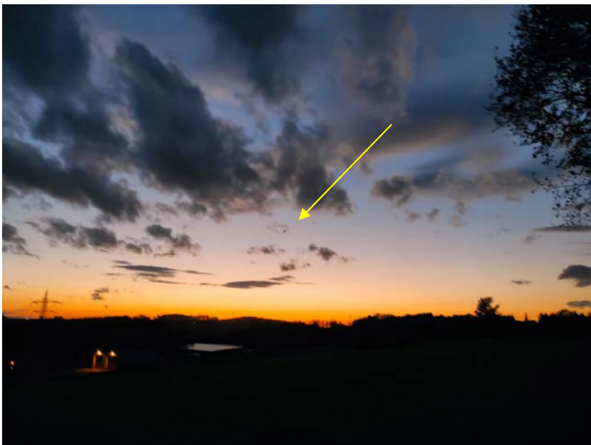
Abb. 3 Blick vom Waldrand in westlicher Blickrichtung mit Markierung eines Fledermausexemplars im Flug