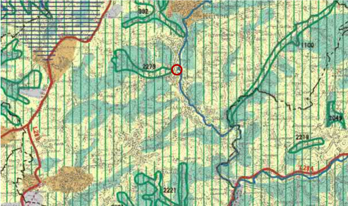
Abb. 1: Regionalplan für den Regierungsbezirk Köln, Teilabschnitt Region Köln mit Planstandort