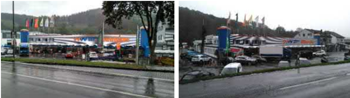
Abb. 4: Planstandort und nähere Umgebung

Die Pkw-Erschließung erfolgt über die westlich verlaufende Wipperfürther Straße sowie die unmittelbar zum Planstandort führende Industriestraße. Über diese Anbindung kann der einwohnerstärkste Gemeindeteil Kürten in rd. fünf Minuten erreicht werden. Im Hinblick auf den ÖPNV ist der Planstandort über die in an der Wipperfürther Straße liegende Haltestelle Kürten Breibacher Weg an das regionale Nahverkehrsnetz angebunden. Von dort bestehen Verbindungen in das gesamte Gemeindegebiet sowie das Umland.