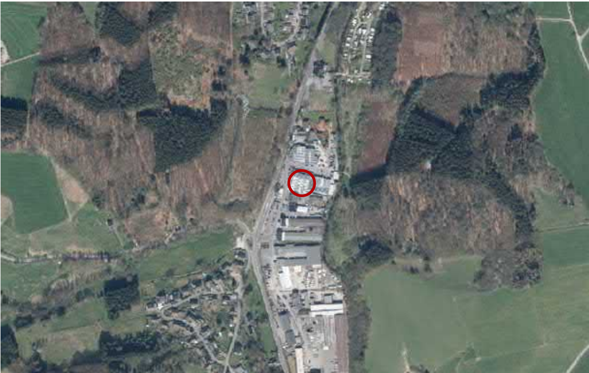
Abb. 3: Luftbild mit Planstandort