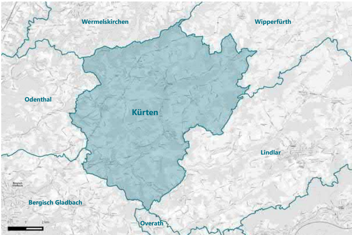
Abb. 7: Einzugsgebiet des Erweiterungsvorhabens