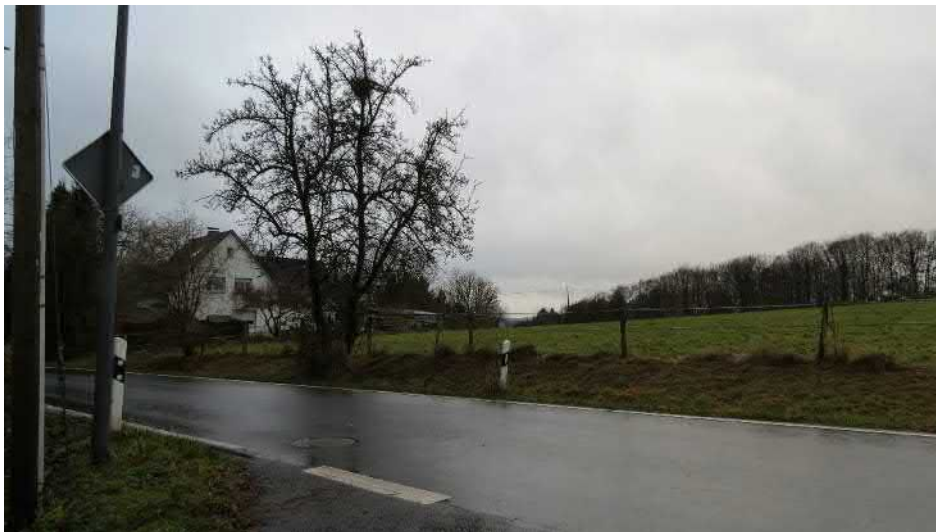
Abbildung 5 + 6: Blick von der Straße -Forsten- zum Ergänzungsbereich