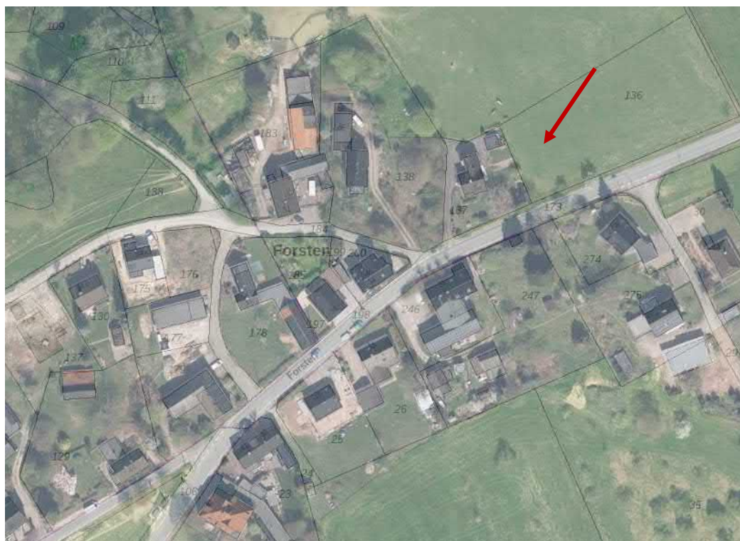
Abbildung 2: Luftbild zum Satzungsgebiet

© GeoBasis-DE / BKG 2020 / Eurographics / Bezirksregierung Köln Geobasis NRW, ohne Maßstab, genordet