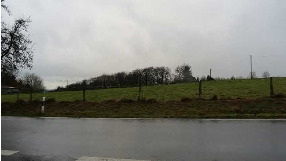
Abbildung 7 + 8: Blick über den Ergänzungsbereich zu den westlich angrenzenden Häusern