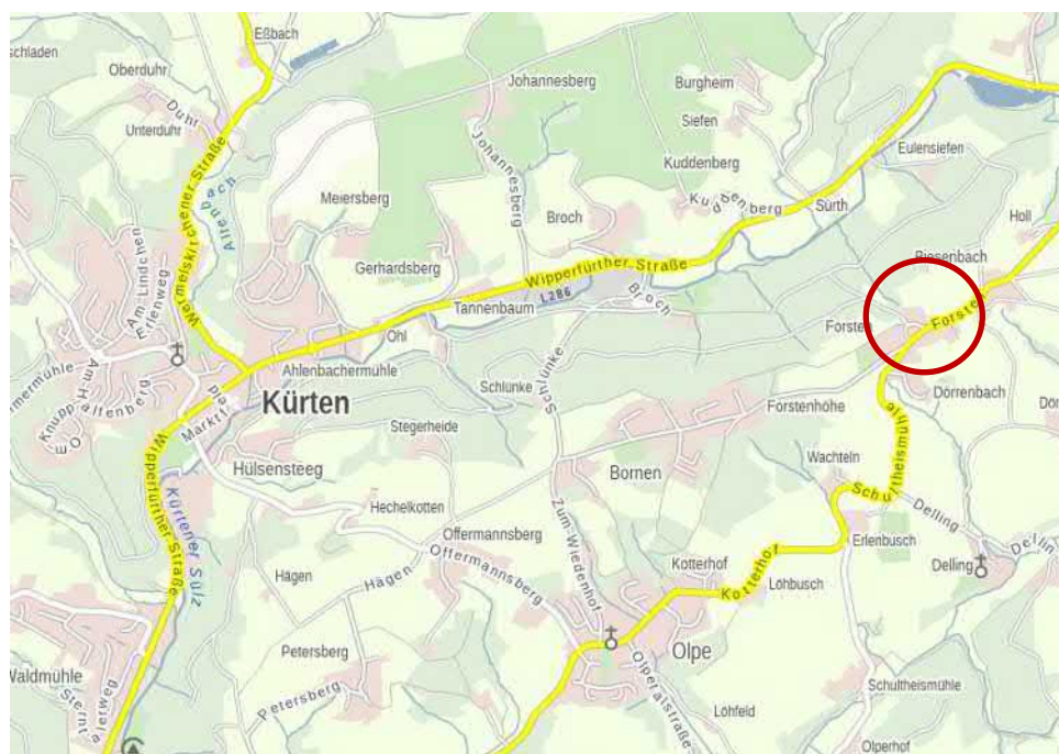
Abbildung 1: Übersichtskarte zum Satzungsgebiet

© GeoBasis-DE / BKG 2020 / Eurographics / Bezirksregierung Köln Geobasis NRW, ohne Maßstab, genordet